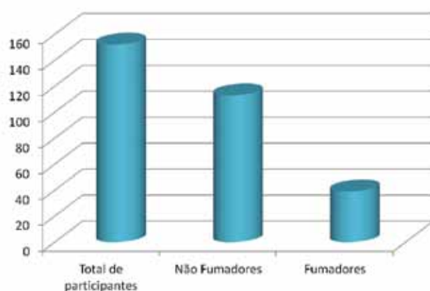
■ Rastreio da Voz